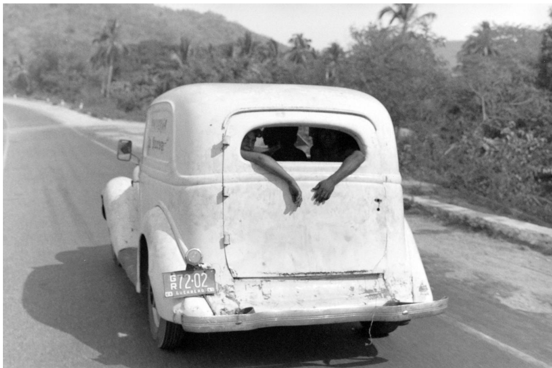
Claudine Doury, "Katia", 2002.